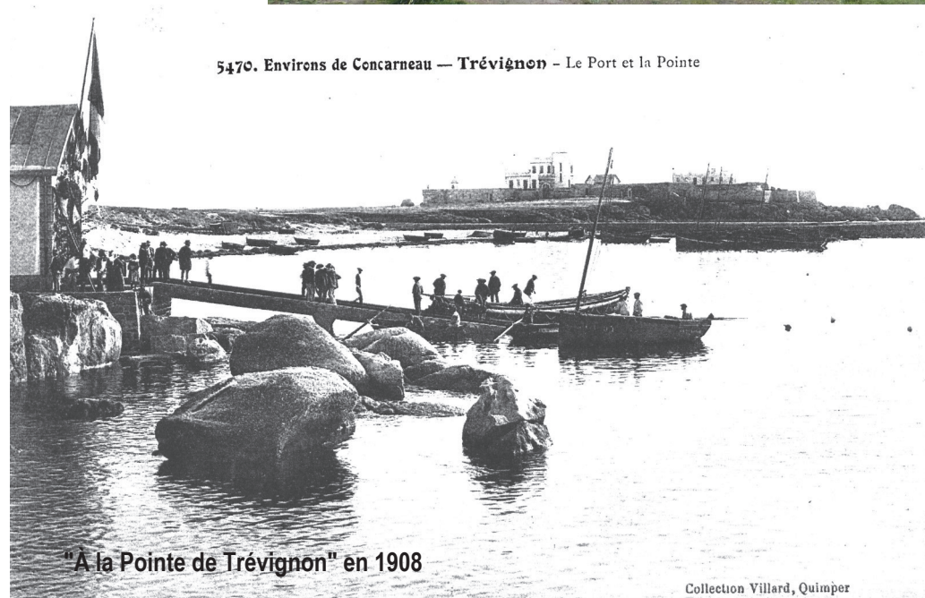
"À la Pointe de Trévignon" en 1908

5470. Environs de Concarneau — Trévignon — Le Port et la Pointe