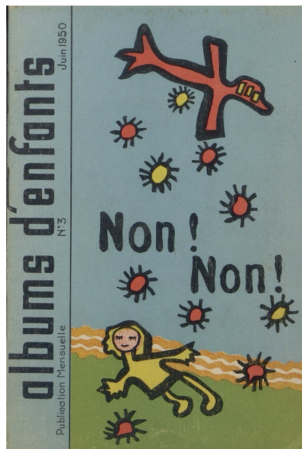
Albums d'enfants n° 3 - juin 1950 École de Paudure (Belgique)